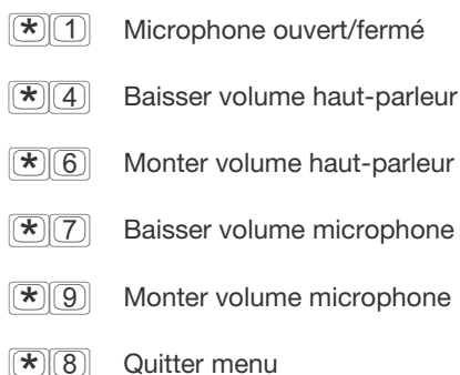
Tableau de contrôle

En appuyant pendant la réunion sur la touche étoile (*), vous entendrez un choix d'un certain nombre de fonctions pratiques: